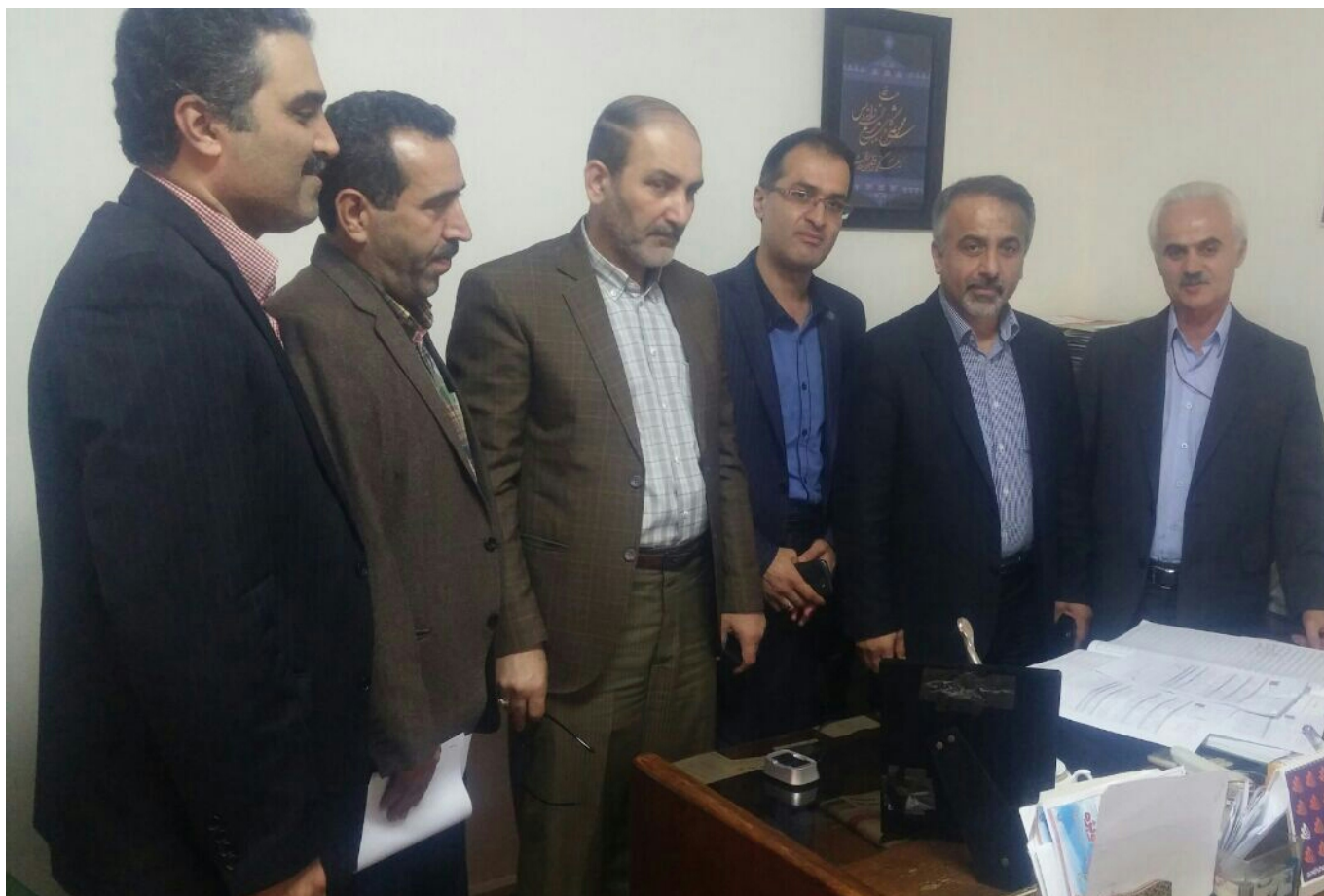
کانون سردفتران و دفترباران استان گیلان